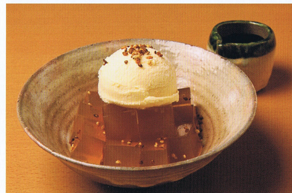
オリジナルの寒天スイーツ「蕎麦茶寒天バニラ」530円。自家製の黒蜜をかけて食べてもらうようにしている。