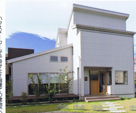
ハウスメーカーが手掛けた2階建ての建物で、2階が住まいで、1階スペースを店舗として利用している。商住兼用店舗にありがちな生活感を感じさせない見事な造りで、入り口までのアプローチを考案している。