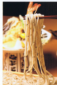
粗挽きで、極細の手打ち蕎麦にこだわっている。