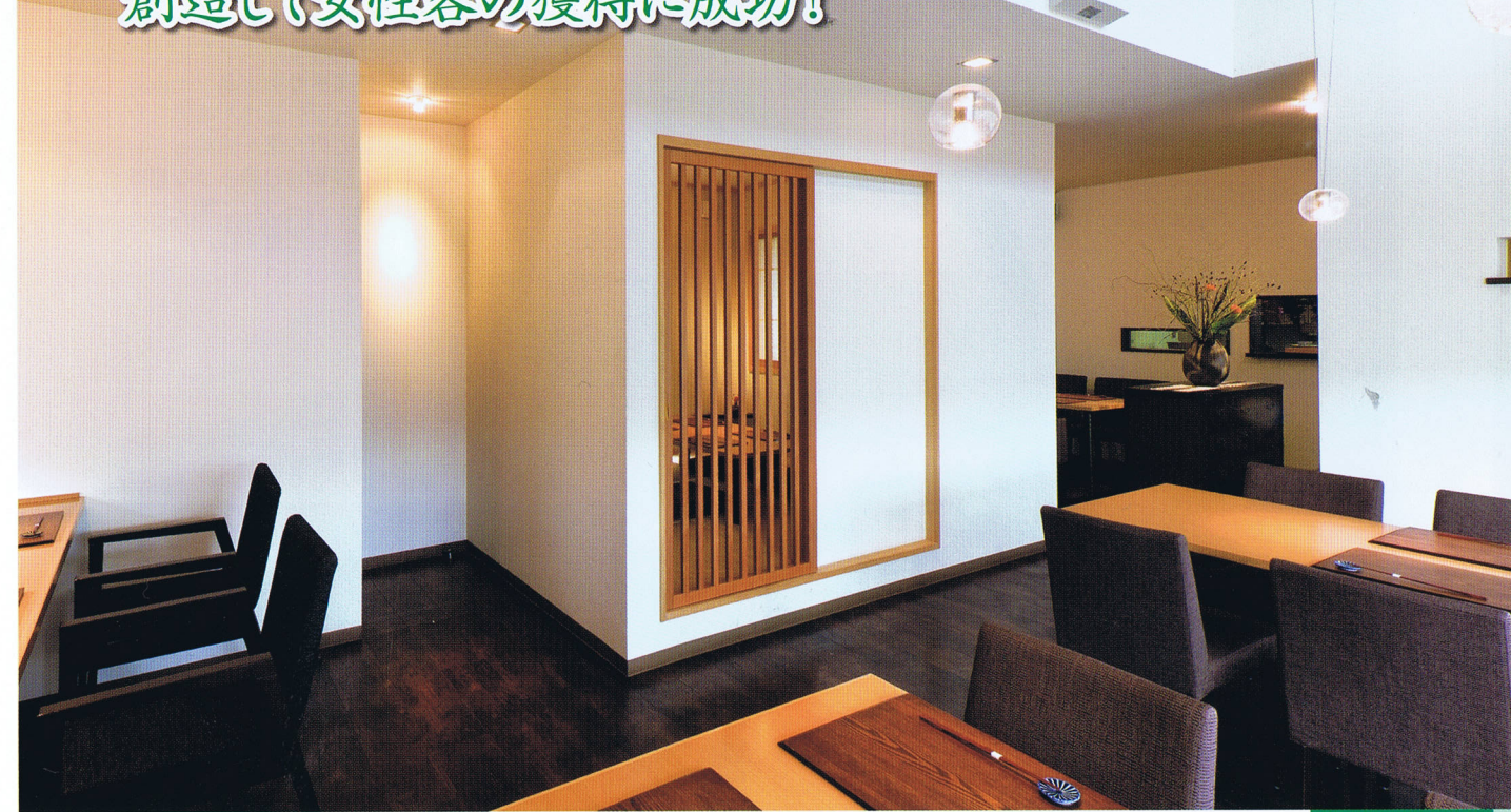
狭いスペースを巧みに利用して、テーブル席、個室、カップル用の壁付きカウンター席など雰囲気異なる4つの客席から構成している。客席に合わせて、すべて異なる椅子を使い分けている。

こだわりの手打ち蕎麦と甘味が ゆっくり楽しめる非日常空間を 創造して女性客の獲得に成功!