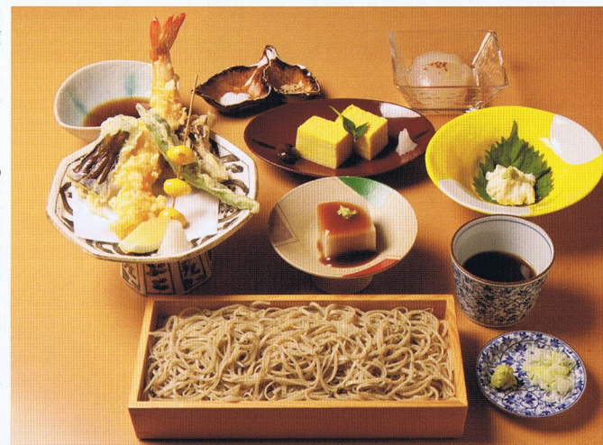
お昼のちよこつとコース「お昼のちよこつとコース」1680円。蕎麦豆腐、だし巻き玉子、生湯葉刺身、特上大海老、野菜四品の天ぷら、せいろ、自家製甘味。