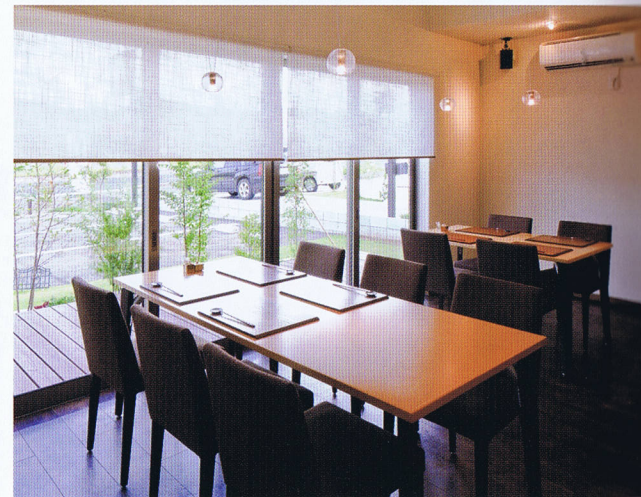
ベランダのデッキに面して設けた、採光が十分にきいた明るいテーブル席。外のデッキや芝生の延長線上にあるような巧みな設計で、店内を広く見せている。

粗挽きの、極細にこだわった手打ち蕎麦はそば本来の風味が楽しめる素朴で上品な味わいが魅力。そばを使った一品料理や甘味も充実しており、そばと料理と甘味が一緒に楽しめるコースをおすすめして好評である。これらのこだわり商品に加えて、この店の人気を支えるもう一つの大きな魅力になっているのが主力客層である女性客に合わせて設計した「ほっと寛げる非日常空間」だ。建築工事はハウスメーカーが行い、店舗はエスデザインワークスが設計して完成させたもので、女性が「ゆっくり美味しい蕎麦を味わうには一番。来てみてよかった」と思わせる内装と数々の工夫が店内のいたる所に見られる。店舗面積は19坪の小規模店だが、スペースの狭さを感じさせない巧みな造り。お客様の人数や利用動機に合わせて、入り口を入って正面のテーブル席、畳敷きの個室、壁付きのカップル用のカウンター席、吹き抜け天井の下に設けた開放的で明るいテーブル席と雰囲気異なる4つのコーナーから客席構成している。